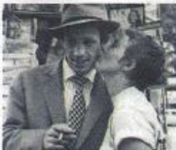
A bout de souffle

Les 15 èmes Rencontres Culture et Cinéma de Vence sont placées sous l'égide de deux choses et une époque qui me sont chères : le jazz et le cinéma de la fin des années 50 et du début des années 60.