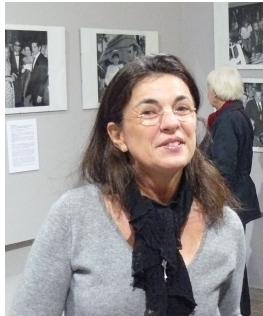
Stéphane MIRKINE , Photographe, petite-fille de Léo Mirkine