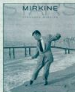
Les photos de Mirkine font l'objet d'un livre sur les stars des années 50 et 60.

Mirkine est, entre autres, l'auteur des premiers portraits de ceux et celles qui deviendront d'énormes stars : Brigitte avant qu'elle soit Bardot, Martine avant qu'elle devienne Carol, Gérard pas encore Philippe, Alain sans Daron (oh oui, cela a existé...) et Sophia avant La « Loren ». Les œuvres de l'artiste seront présentées par sa petite fille, Stéphane Mirkine. L'expo sera visible du 15 au 28 no-