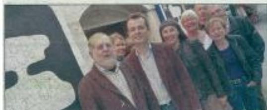
L'équipe du festival a encore réussi un tour de force pour une manifestation « populaire, de qualité et conviviale ».

FESTIVAL Du 14 au 22 de ce mois, l'association « Culture et cinéma » propose une immersion très prometteuse dans la magie du 7 e Art